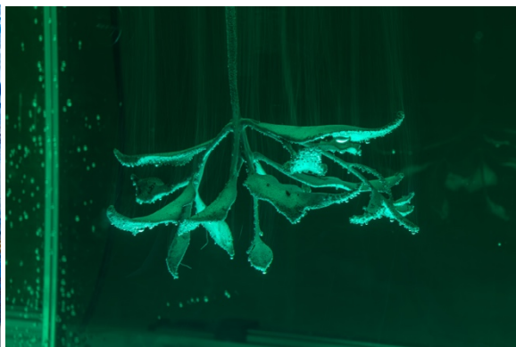
左：展示風景「Kei Imazu: The Sea is Barely Wrinkled」Museum MACAN（ジャカルタ）2025年、Photo courtesy Liandro Siringoringo 右：バグース・パンデガ《Anim Wraksa》2025年、Photo: Daniel Pérez, courtesy of Swiss Institute

今津景 1980年山口県生まれ。バンドン（インドネシア）を拠点に活動。インターネット時代の膨大な画像アーカイブを掘り起こし、断片化したデジタル空間を考古学的に再構成する。リサーチを基盤に3Dレンダリングやデジタルスケッチを用いて下絵を組み立て、CGIやUnreal Engine、3Dプリントも導入しつつ、直感と身体感覚に根ざした絵画を展開。2018年のインドネシア移住以降は、群島部の神話・口承と多層的な植民地史、日本の戦時関与を層々の領域として扱い、近年は東京オペラシティアートギャラリーやMuseum MACANでの個展を通じて、映像・彫刻・没入型インスタレーションへと表現を拡張している。