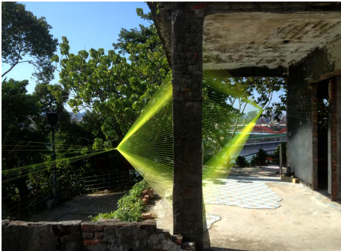
画像① 作品参考写真 (宝蔵院芸術家村/台北)