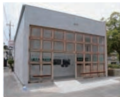
宮浦ギャラリー六区 外観