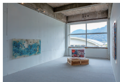
(左) Chim ↑ Pom「都市は人なり」2016年 (中) ヒルミー・P・スパドモ「Compressed Object of Commodification #2」2019年 (右) カンチャナ・グプタ「緑と残留物 08 - シェナとセルリアン・ブルーに白01」2018年