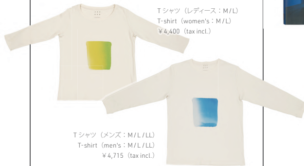
Tシャツ (レディース: M/L) T-shirt (women's: M/L) ¥4,400 (tax incl.)