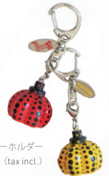
南瓜キーホルダー Pumpkin Key Holder ¥1,650 (tax incl.)