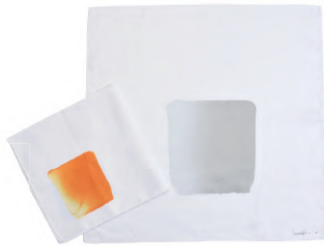
李禹煥美術館オリジナルハンカチ Original handkerchief ¥3,143 (tax incl.)