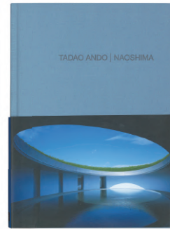
TADAO ANDO | NAOSHIMA Le Bon Marche ¥2,000 (tax incl.)