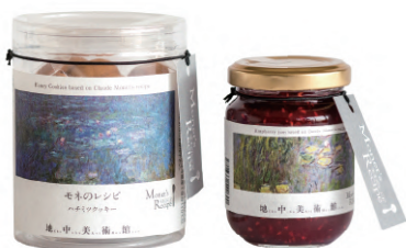
モネのレシピのはちみつクッキー Honey cookies based on Claude Monet's recipe ¥540 (tax incl.) モネのレシピのラズベリージャム Raspberry jam based on Claude Monet's recipe ¥648 (tax incl.)