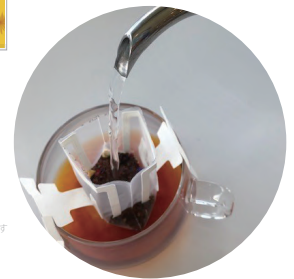
直島ドリッピングティー オレンジロイボス Naoshima Drip Tea Orange roibos (caffein-free) ¥216 (tax incl.)