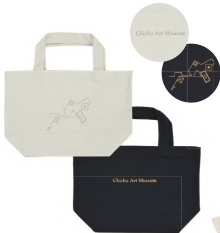
オリジナル トートバッグ (グレー/ネイビー) Original tote bag (Gray / Navy) ¥1,048 (tax incl.)