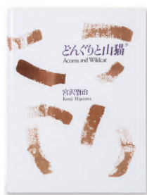
どんぐりと山猫 Acorns and Wildcat ¥2,750 (tax incl.)