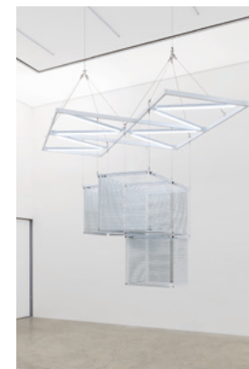
Haegue Yang, Sol LeWitt Upside Down—Steel Structure, Scaled Down 10 Times , 2021