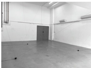
Zul Mahmod, Quiet Resistance Manifesto , 2023