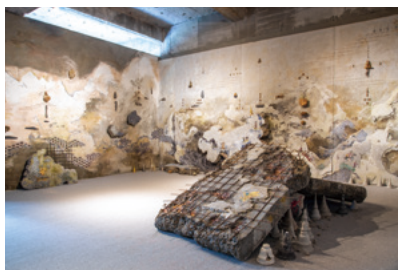
Pannaphan Yodmanee, Aftermath , 2016