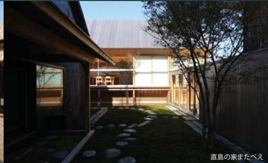
直島の家またへえ