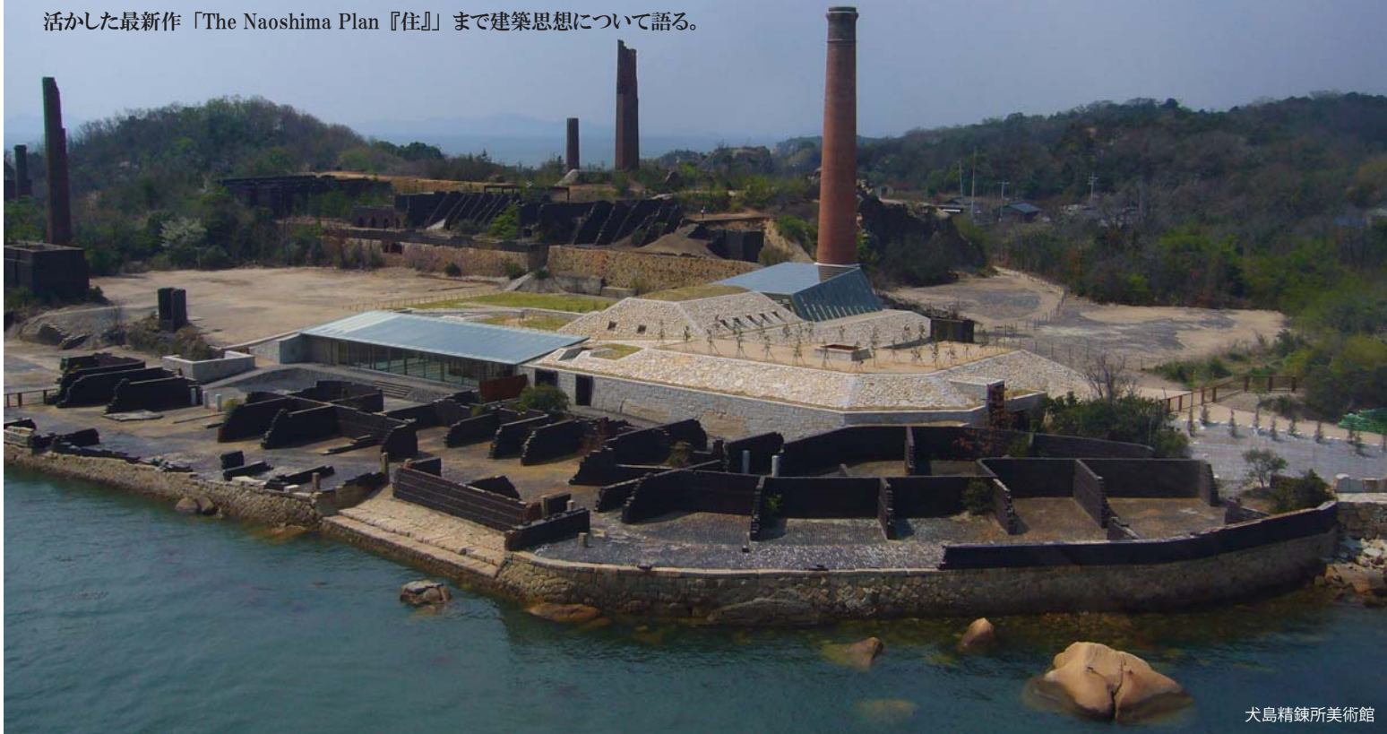
犬島精錬所美術館

活かした最新作「The Naoshima Plan『住』」まで建築思想について語る。