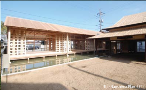
The Naoshima Plan『住』