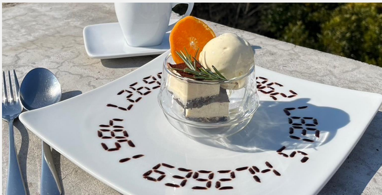
Tiramisu & Vanilla Ice Cream with homemade marinated fruits