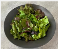
Salad with Lemon Dressing