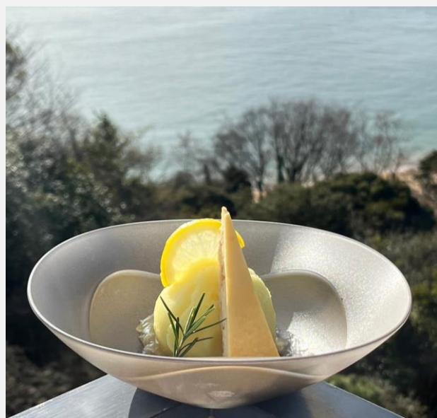
Lemon Sorbet & Cheesecake with Setouchi Lemon Jam