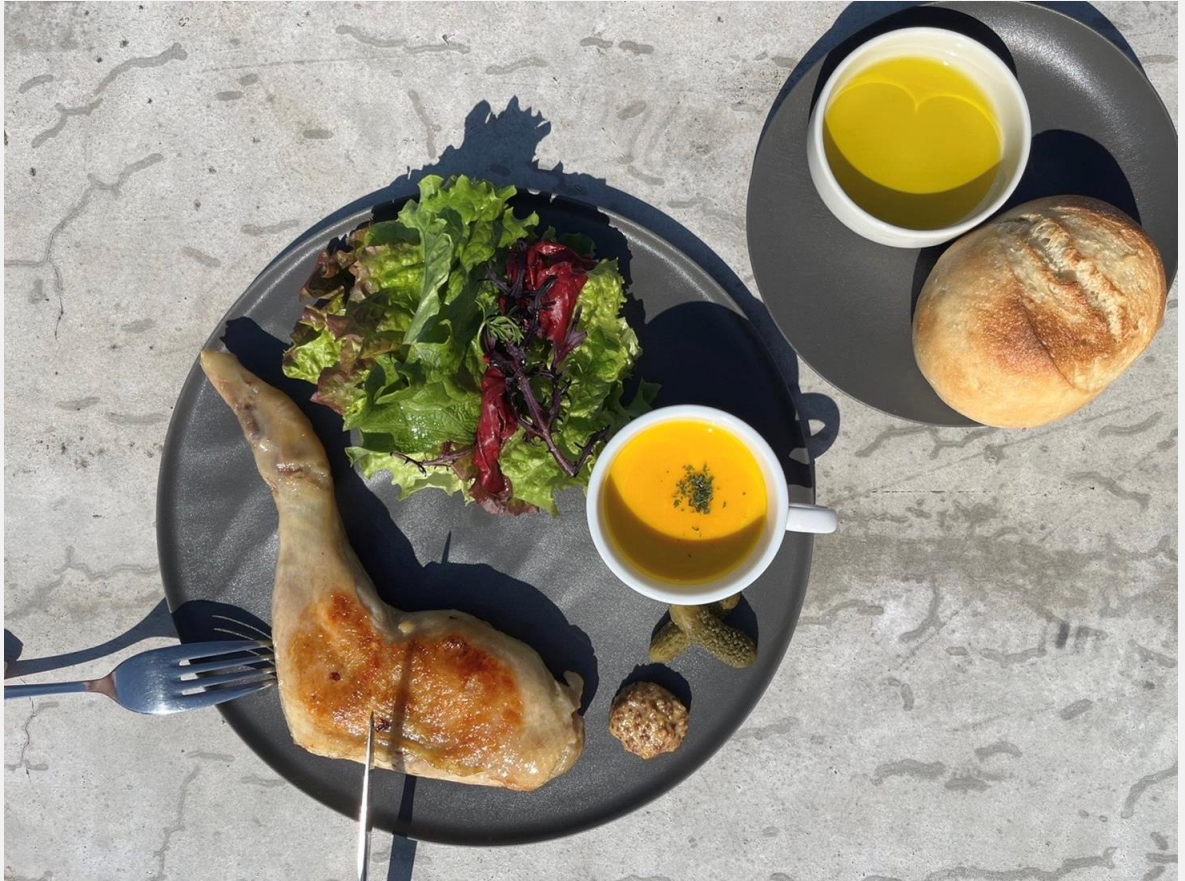
Chicken Thigh Confit with Bread and Soup 岡山県産森林どりを使った鶏もも肉のコンフィ (パン・スープ付き)