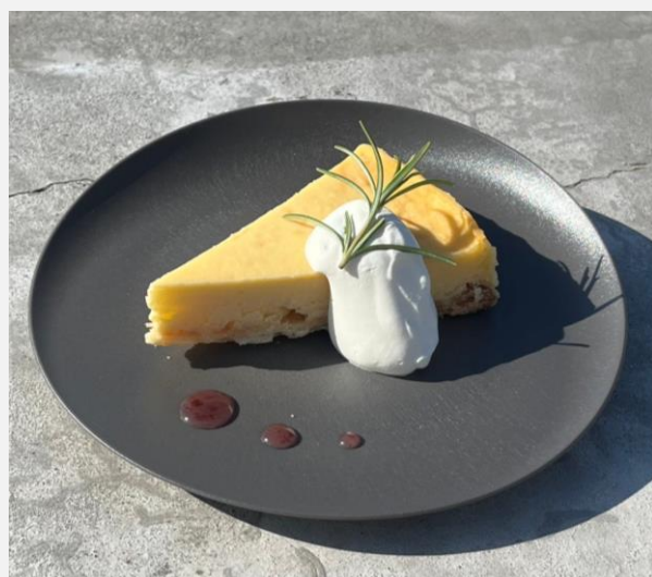
Cheesecake with berry sauce