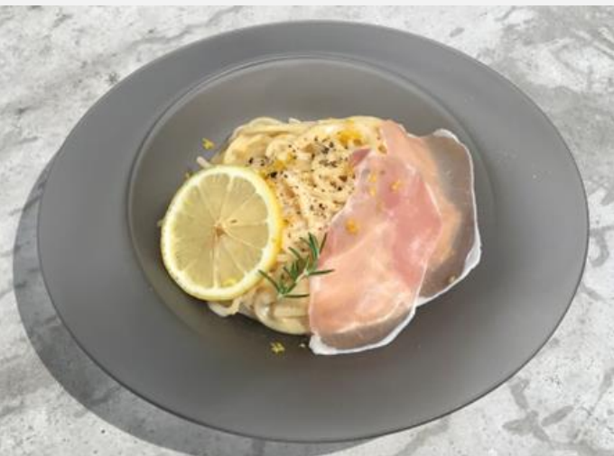
Setouchi Lemon Cream Pasta with Prosciutto