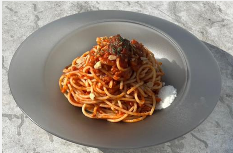
Tomato Sauce Pasta with Soybean Meat ※For vegetarians