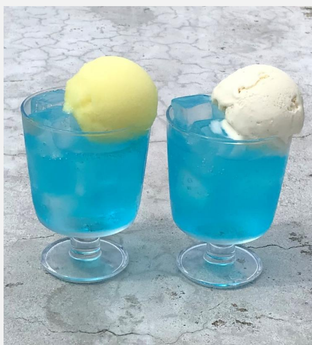
Sora-Iro Cola Float (Lemon Sorbet/Vanilla Ice Cream)