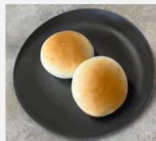
Rice flour bread