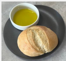
Bread with Olive Oil