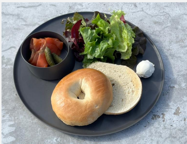
Bagel with Smoked Salmon, Cream Cheese and Green Salad