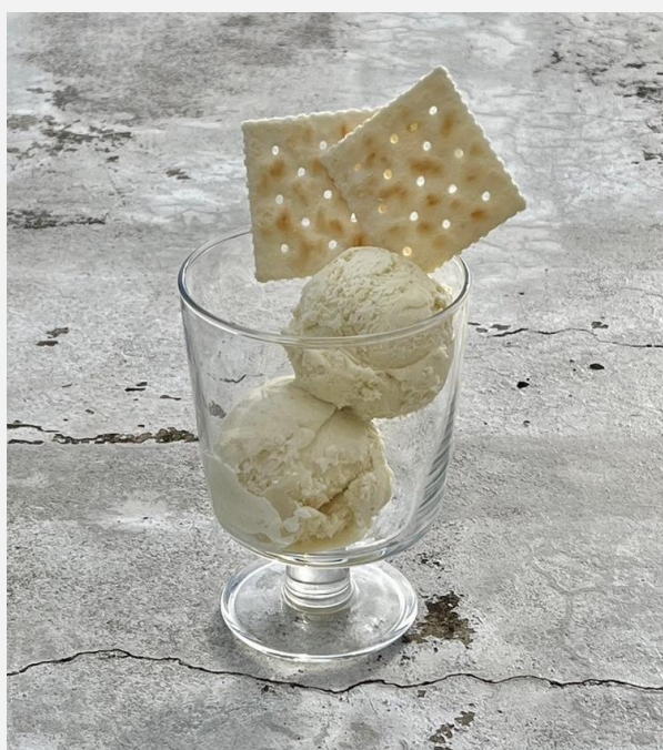
Vanilla Ice Cream